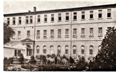
A Mianzonynokból nevezett szegedi iskolánkunk szegedi nevét és tanítékeit: udvari részlet: kápolna, klauzúra, noviciátus.

Nem tartható tovább a Magyar Tartomány szétdarabolt állapota. A Romániához csatolt házakból Temesvár központtal létrejön a Román Tartomány, a Jugoszláviához csatolt bánáti nővéreink a szlovén nővérekkel együtt a Jugoszláv Tartományba tagozódtak be. Csonka-Magyarországon a nővérek új anyaháza a szeged-alsóvárosi zárda lett.