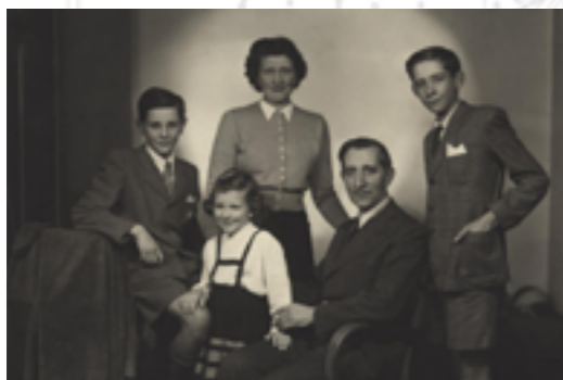
Szüleimmel, két iker bátyámmal a kitelepítés előtt

A háború utolsó évében, 1945-ben láttam meg a napvilágot Budapesten egy magánháza ideiglenesen berendezett szülőotthonban. Édesapám katonatiszt volt, anyai részről pedig „burzsoá” háttérrel volt, ahogy abban az időben a bérháztulajdonos családot bélyegezték.