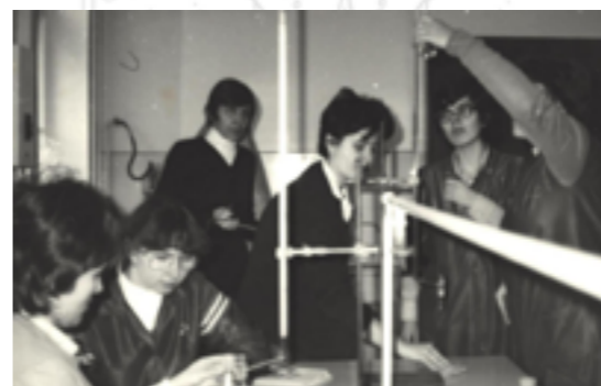
Kísérletezés a kémia szaktanteremben

Debrecenben volt a jelöltség első éve, majd Pesten folytattam. Akkoriban az ÁEH (Állami Egyházügyi Hivatal) úgy rendelkezett, hogy csak diplomaszerezés után kerülhet sor a beöltözésre, így a biológia-kémia tanulmányok után kezddhettem csak meg a novíciátust 27 évesen Debrecenben. 28 évesen tettem le az első fogadalmat 1973-ban.