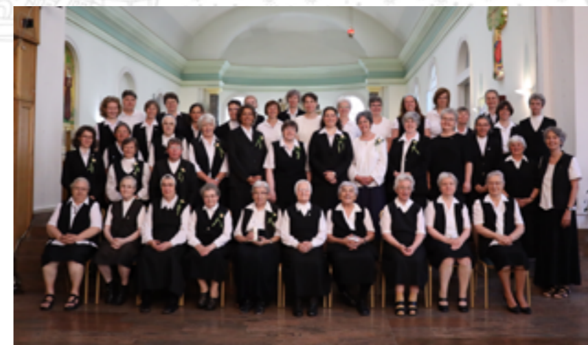
Nővérközösségünk 2023. július 3-án

„KELET FELŐL EGY SÍRNAK MÉLYIBŐL, ELRÚGVA A KÖVET, FÉNYES SEBEKKEL SZÁLL, SZÁLL MAGASBA, FÖL AZ ISTEN-EMBER.” KOSZTOLÁNYI DEZSŐ: FASTI (RÉSZLET)