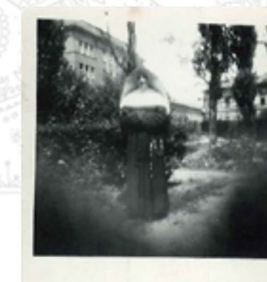
Egy szerzetesi életút állomásai - Tóth M. Jácinta jelöltként (Szeged, 1949, balra), novíciaként ( középen) és fogadalmas nővérként ( jobb oldalon)