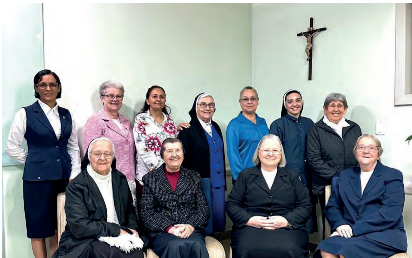
A Sao Jose kórházban szolgáló iskolanővérek

A betegfelvételek és beavatkozások 96 %-át a brazil kormány támogatta.