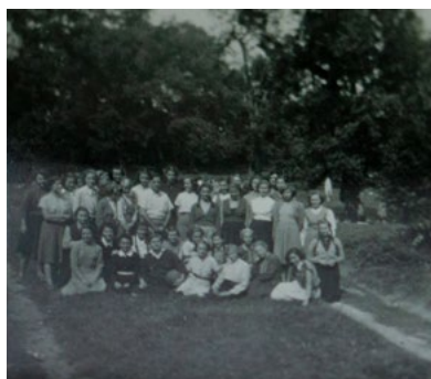
Egy régi patronás kirándulás