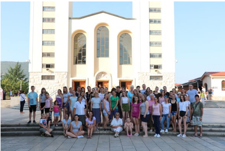
Kollégiumi kiránduláson Medugorjében

Szathmáry Karolina Kollégium Nagybecskerek