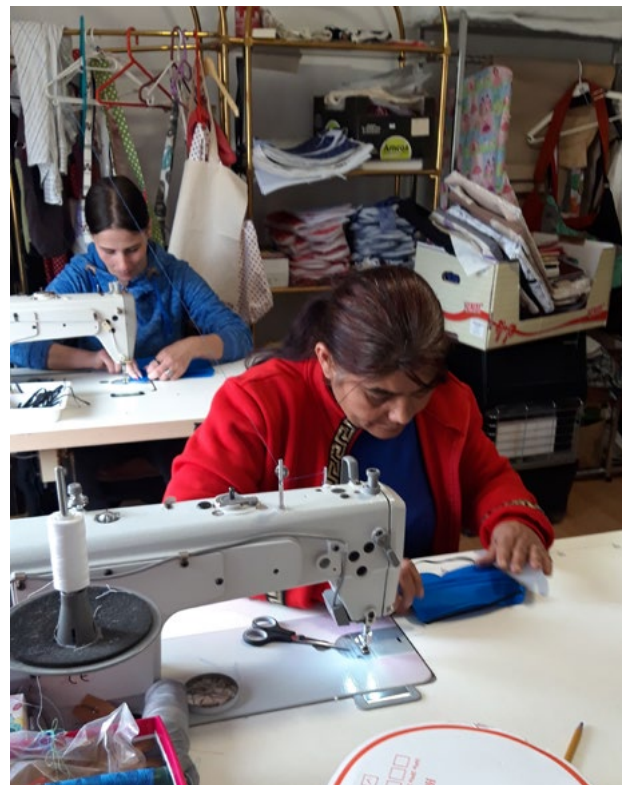
Így készültek a védőmaszkok vécsi varrodánkban

A Gondviselés számtalan formáját tapasztaltam meg ebben az intenzív időszakban a kollegákon, a családomon, néhány nővértársamon és a szorosabb kapcsolataimon keresztül. A szomszédos Markazon