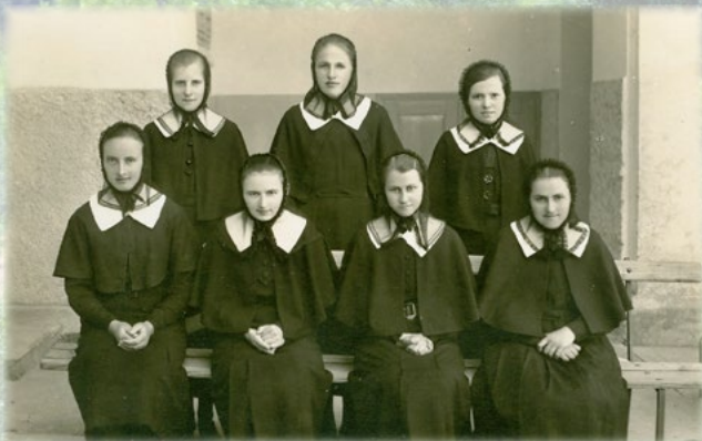
Bánáti nővérjelöltek az 1930-as években