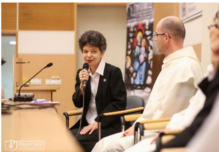
A Szerzetesi Iroda vezetőjeként

– Szent Mónika alakja, aki a háttérből és imával alakítja mások életét, mindig vonzott. Egy atya pedig rákérdezett, hogy ugye rövid o-val írom a nevemet, mivel a név a görög monosz szóból származik, vagyis a jelentése: egységes, egygyé váló, osztatlan . Éppen akkor készítettem a nővéreknek a kártyákat az első fogadalmamra. E kérdés után mindenholnan lehúztam az ékezetet. S még inkább megszerettem a nevemet. De Szent Mónika alakja is fontos maradt.