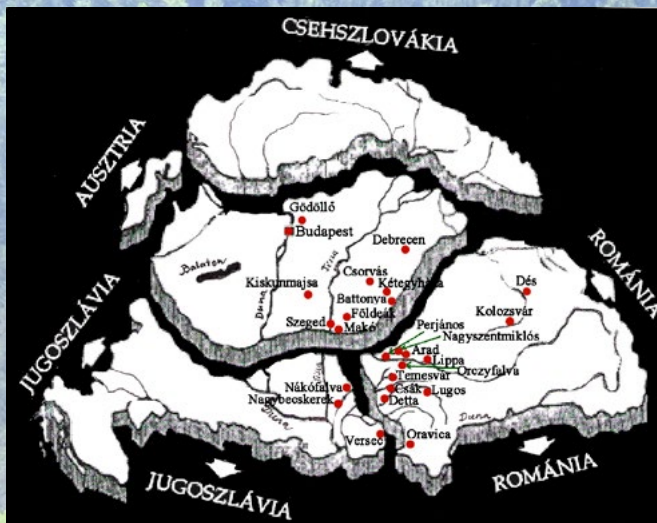
A trianoni döntés következtében a Magyar Tartománytól elszakadt házak

A Magyar Tartomány nővérei ma ismét szolgálnak a Bánátban és Erdélyben.