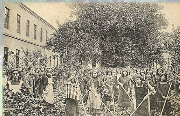
Növendékek a temesvári zárdaiskola kertjében

Impresszum: Bizalom és bátorság – A Boldogasszony Iskolanővérek lapja • www.iskolanoverek.hu • Kiadja: Boldogasszony Iskolanővérek • A szerkesztőség címe: 1092 Budapest, Knézich utca 5 – 7. • Telefon: +36 1 215-9017 • E-mail: info@iskolanoverek.hu • Felelős kiadó: Lobmayer Ágnes M. Judit SSND • Alapító főszerkesztő: Lobmayer Ágnes M. Judit SSND • Főszerkesztő: Koncz Veronika • Arculat, layout: Katona Zsófia