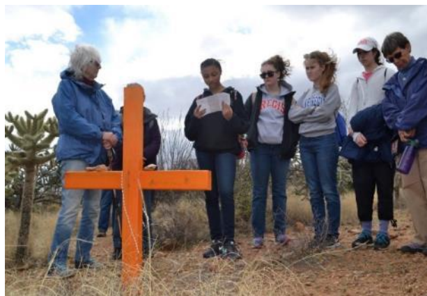
A Holy Angels Academy diákjai imádkoznak egy sivatagban elhunyt migráns sírjánál.

Arra kérünk benneteket, hogy csatlakozzatok hozzánk az igazságos és humánus emigrációs reformért szóló imádságban, és annak a napnak az eljöttéért, amikor nem kell majd az illegális határátlépés kockázatát vállalni, hogy a család együtt élhessen vagy valaki olyan munkát vállalhasson, ami biztosítja a család szükségleteit. A Douglasba látogató diákokról további képek tekinthetők meg itt online .