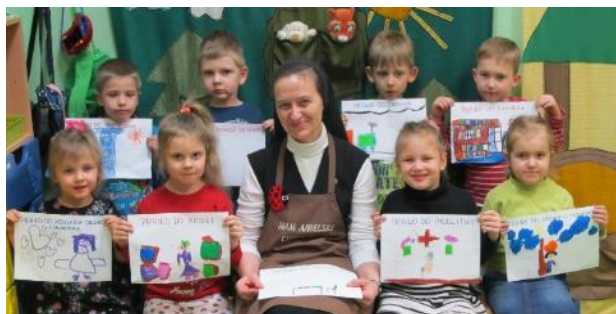
Lengyelországi óvodások képeket rajzolnak az emberi jogokról.