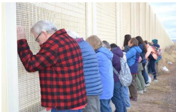
Diákok és tanárok imádkoznak a határkerítésnél.

Itt, Dél-Arizona és Mexikó határán azért dolgozunk, hogy felhívjuk a figyelmet arra a valóságos helyzetre, hogy a sivatagban migránsok lelik halálukat. A helyi közösség tagjait, és vendégeket elvezettük azokra a helyekre a sivatagban, ahol egy migráns földi maradványait megtalálták. Ezekről a sajátos megemlékezési zárandoklatokról online