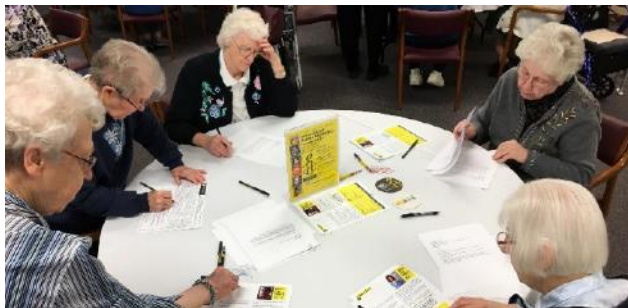
Elm Grove-ben leveleket írnak a nők emberjogi állásfoglalásuk miatt bebörtönzött embereknek.

Több, mint 150 levelet indítottak mind a nyolc általuk felkarolt ügyre vonatkozóan! A napot inspiráló reflexió zárta olyan emberek történeteiről, akiken segítettek az évek során megírt leveleink. Nagyszerű módon ünnepeltük meg az Emberi jogok világnapját az Advent és az SSND szellemiségében.